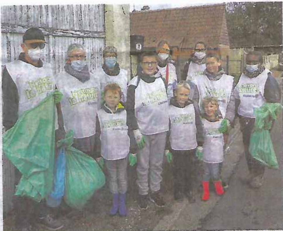
Quelques-uns des participants à l'opération « Nettoyons la nature » à Sully-Flibeaucourt

Coup de balai. La société d'émulation arts et sports a participé pour la première année à l'opération régionale « Nettoyons la nature ». En ce samedi matin, une quarantaine de personnes - petits et grands - répartie en plusieurs groupes a sillonné la commune à la recherche de tout ce qui n'a pas sa place dans notre nature : capsules, bouteilles, plastiques, emballages... Tout en participant à un quiz au cours duquel on apprenait les origines du mot « poubelle » ou encore que chaque français produit en moyenne plus d'un kilo de déchet par jour... À l'issue de la collecte, on a trié les déchets avant de les expédier en déchetterie, puis les participants ont partagé un pique-nique dans le parc de la mairie. Les organisateurs n'étaient pas peu fiers du succès rencontré pour cette initiative écologique et citoyenne.