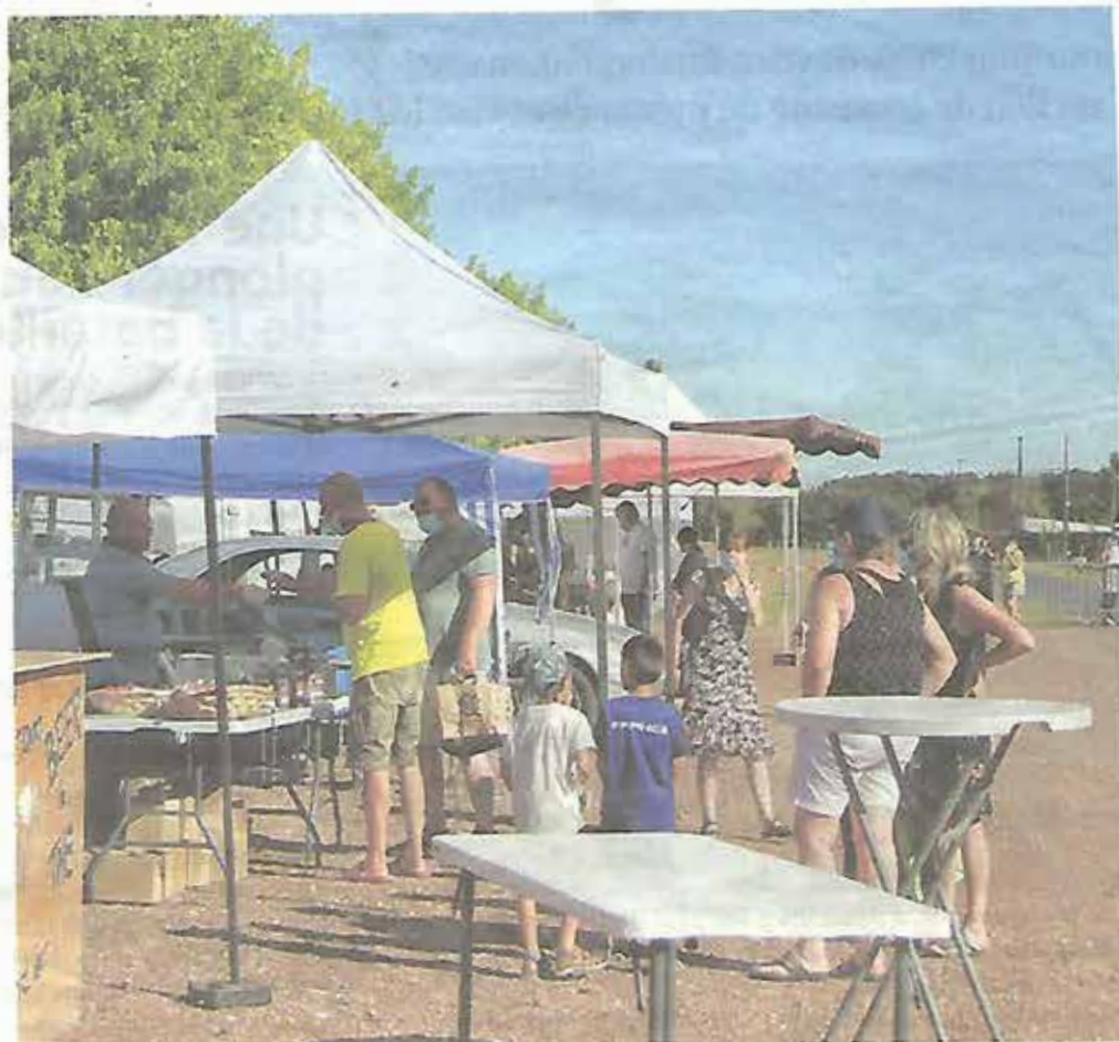
Le marché pourrait revenir tous les quinze jours ou tous les mois de 17 heures à 21 heures.

Les deux partis se sont rencontrés lundi 17 août pour décider à quelle fréquence pourrait se tenir de nouveau le marché de Sailly. Il pourrait revenir à raison d'une fois tous les quinze jours.